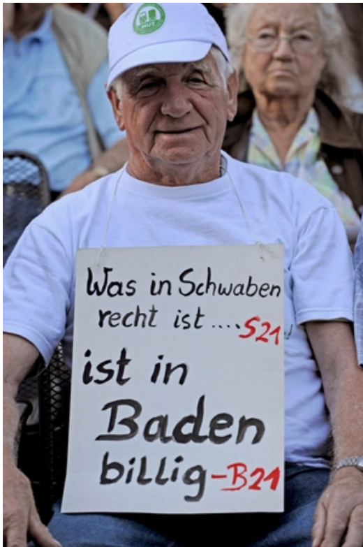
Gespräche und Protest: Bahnchef Rüdiger Grube besucht Bad Krozingen