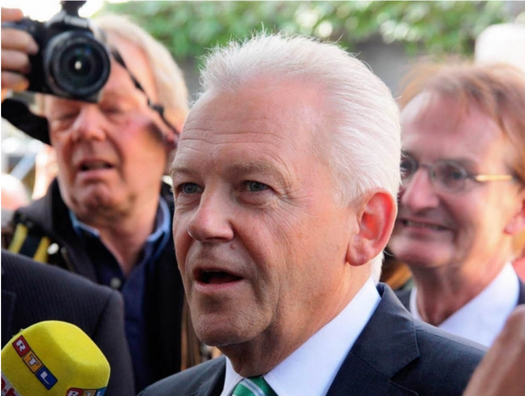
Gespräche und Protest: Bahnchef Rüdiger Grube besucht Bad Krozingen