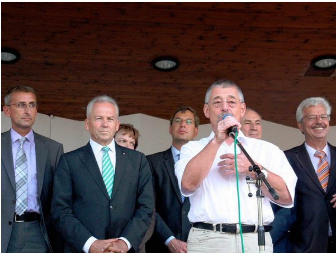
Gespräche und Protest: Bahnchef Rüdiger Grube besucht Bad Krozingen