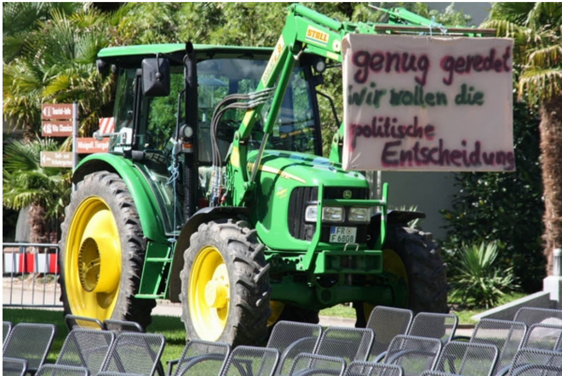
Bahnchef Rüdiger Grube zu Gesprächen in Bad Krozingen über Baden 21