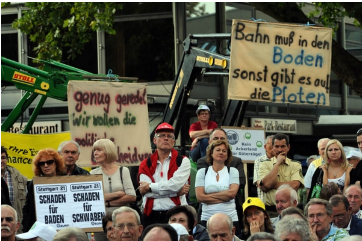
Gespräche und Protest: Bahnchef Rüdiger Grube besucht Bad Krozingen