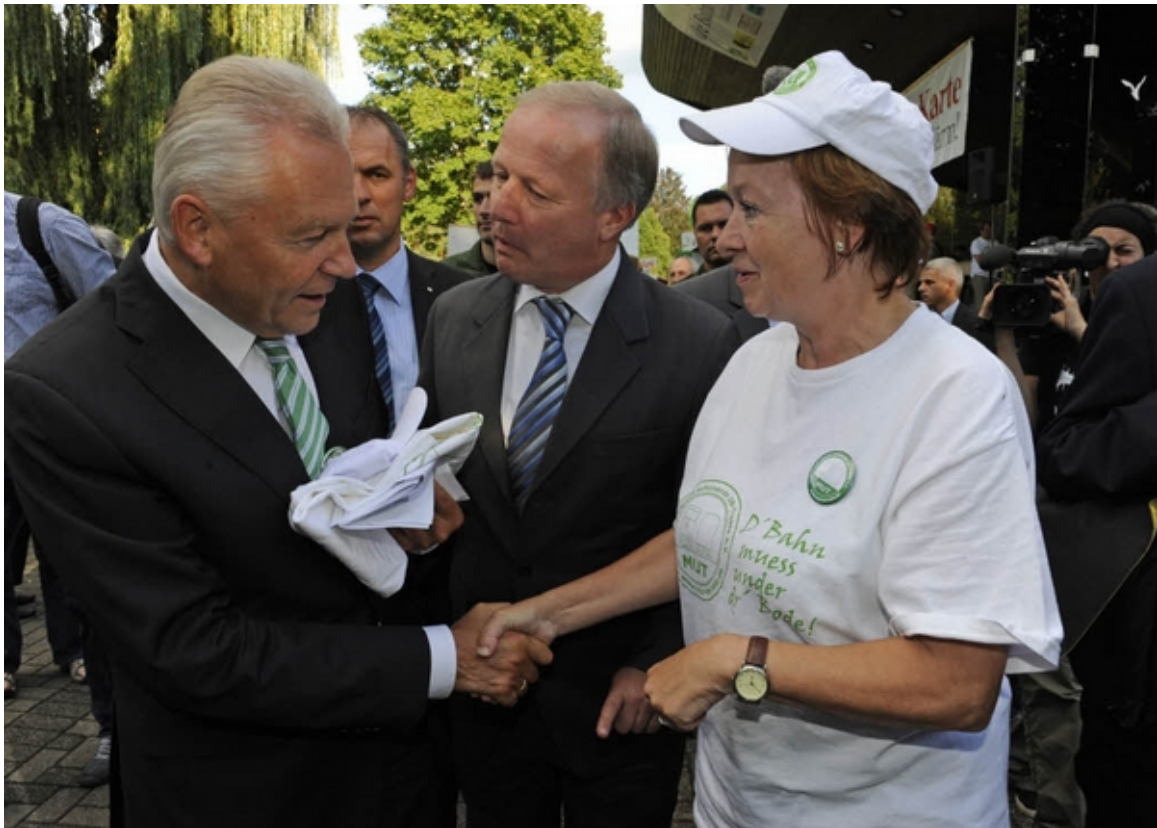
Gespräche und Protest: Bahnchef Rüdiger Grube besucht Bad Krozingen