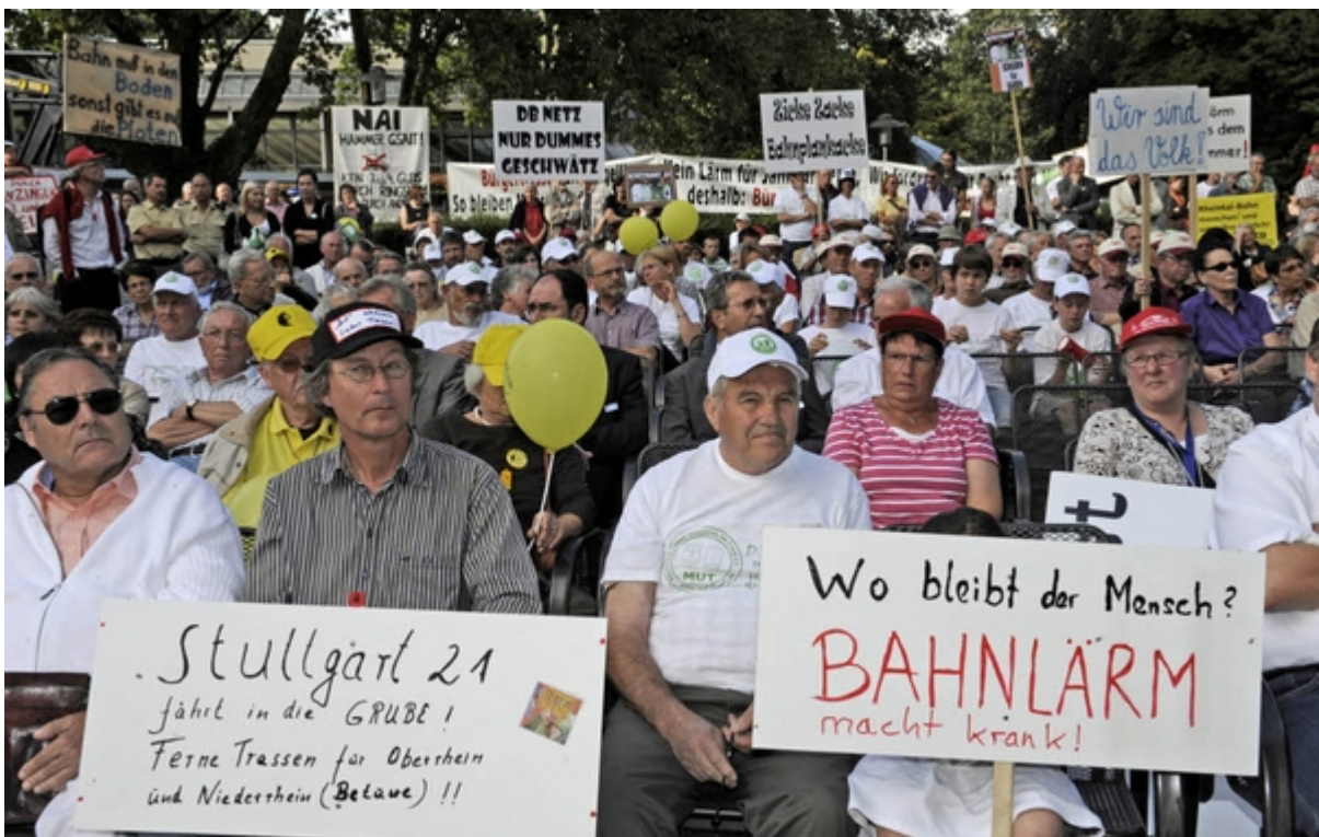
Gespräche und Protest: Bahnchef Rüdiger Grube besucht Bad Krozingen