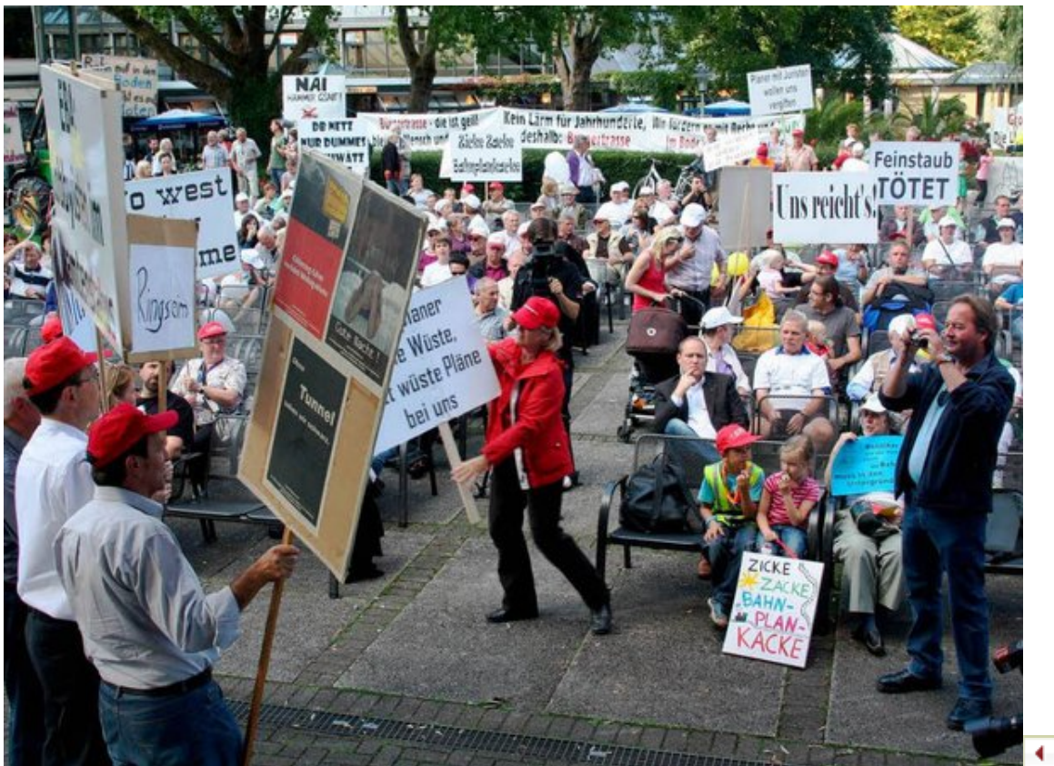
Gespräche und Protest: Bahnchef Rüdiger Grube besucht Bad Krozingen