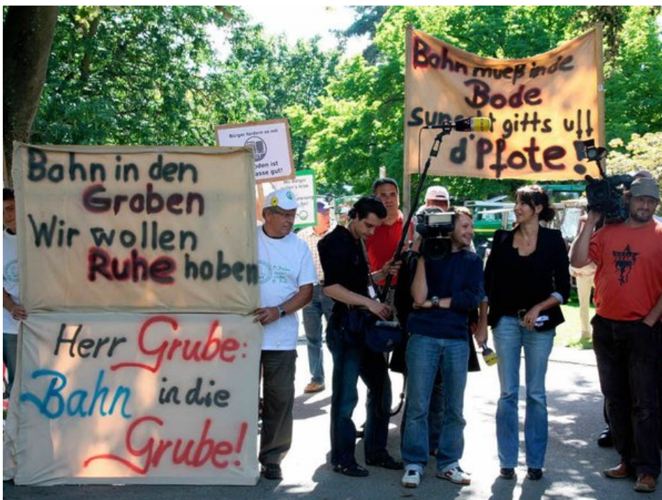
Gespräche und Protest: Bahnchef Rüdiger Grube besucht Bad Krozingen.