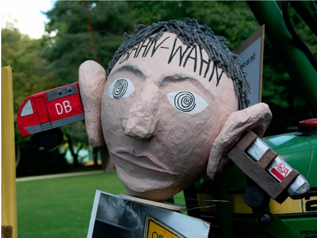
Gespräche und Protest: Bahnchef Rüdiger Grube besucht Bad Krozingen