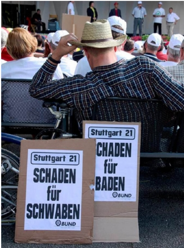
Gespräche und Protest: Bahnchef Rüdiger Grube besucht Bad Krozingen