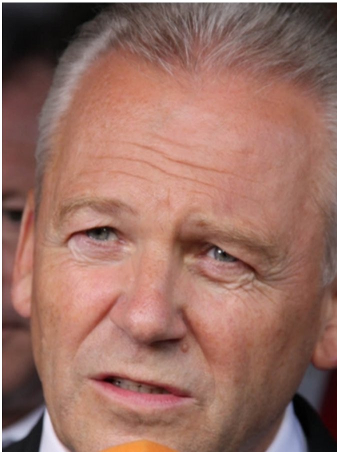
Zeigte Gesprächsbereitschaft: Bahnchef Rüdiger Grube