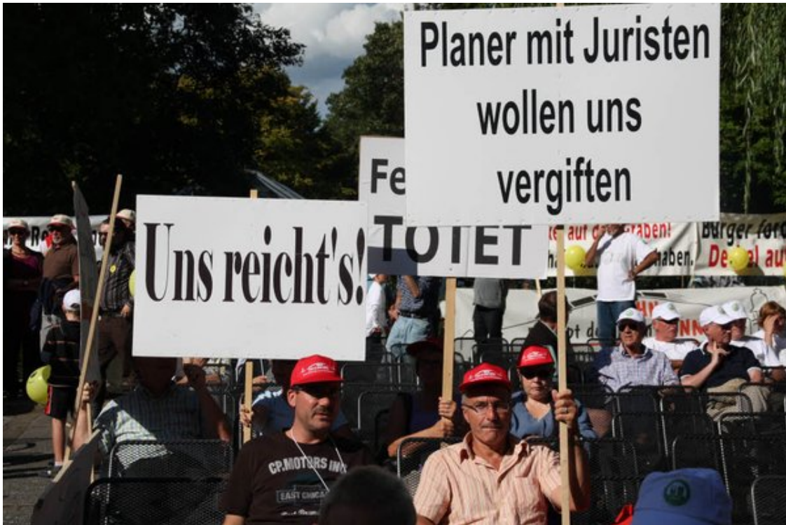
Proteste gegen Bahnpläne zum Ausbau der Rheintalbahn anlässlich des Besuchs von Bahnchef Rüdiger Grube in Bad Krozingen