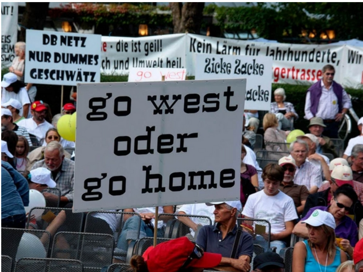
Gespräche und Protest: Bahnchef Rüdiger Grube besucht Bad Krozingen