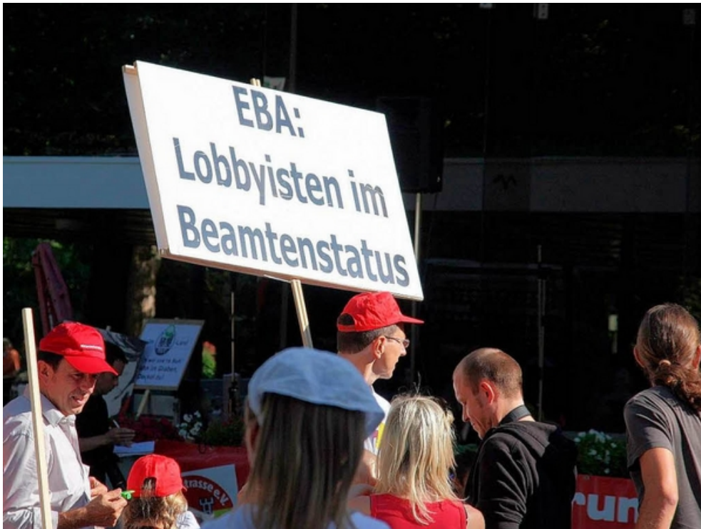
Gespräche und Protest: Bahnchef Rüdiger Grube besucht Bad Krozingen