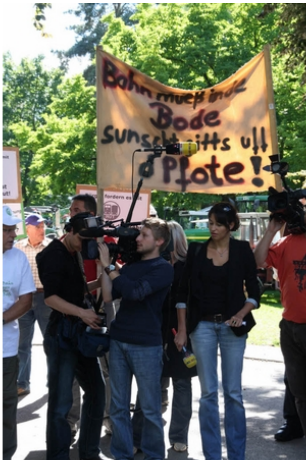
Bahnchef Rüdiger Grube zu Gesprächen in Bad Krozingen über Baden 21