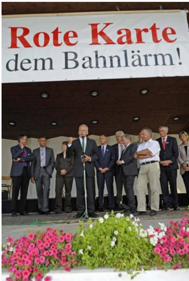
Gespräche und Protest: Bahnchef Rüdiger Grube besucht Bad Krozingen