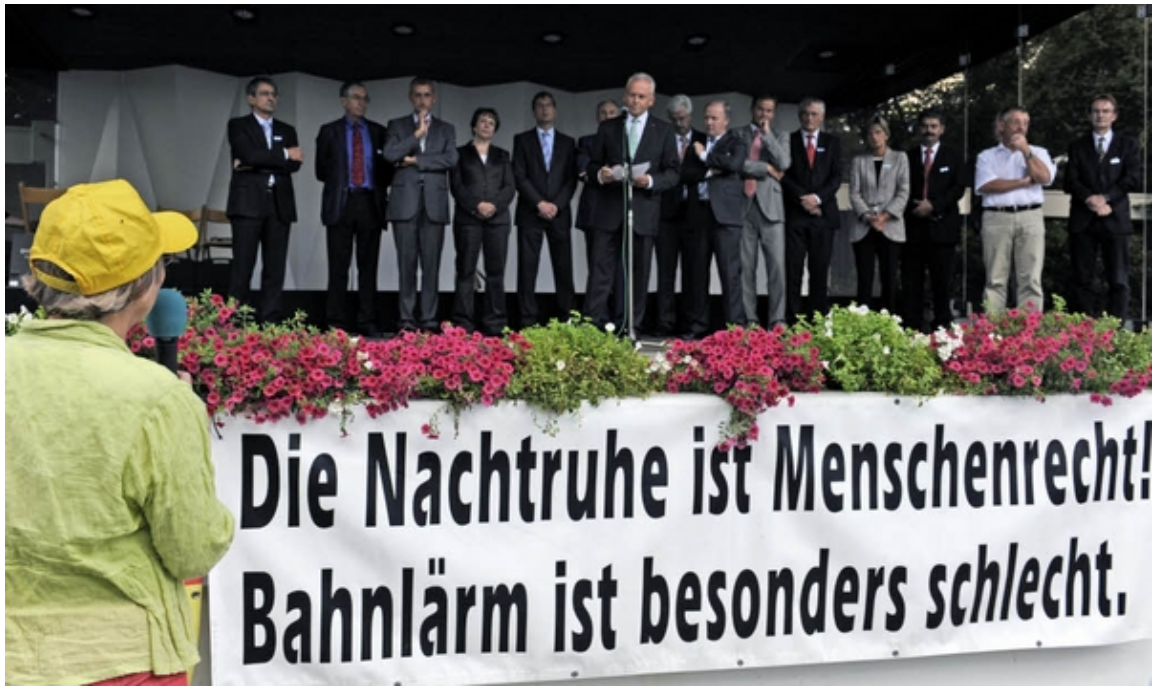
Gespräche und Protest: Bahnchef Rüdiger Grube besucht Bad Krozingen