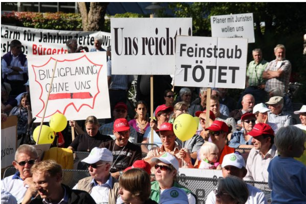
Proteste gegen Bahnpläne zum Ausbau der Rheintalbahn anlässlich des Besuchs von Bahnchef Rüdiger Grube in Bad Krozingen