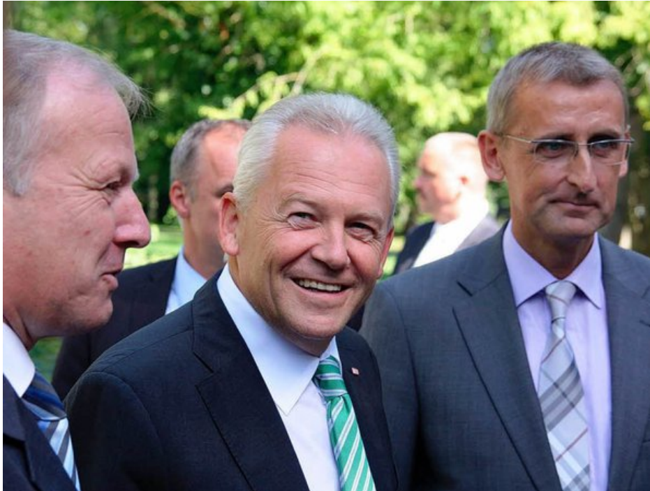
Im Anmarsch: Rüdiger Grube mit den CDU-Bundestagsabgeordneten Peter Weiss (links) und Armin Schuster.

Von rund 350 Demonstranten und einem großen Medienaufgebot ist Rüdiger Grube in Bad Krozingen empfangen worden. Im Kurhaus sprach der Bahnchef mit Vertretern aus der Region über den Ausbau der Rheintalbahn. 10. September 2010