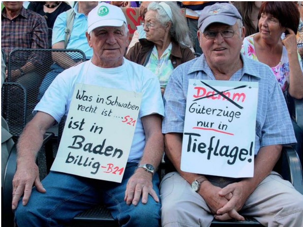
Stuttgart 21: Der Wink mit dem Zaunpfahl