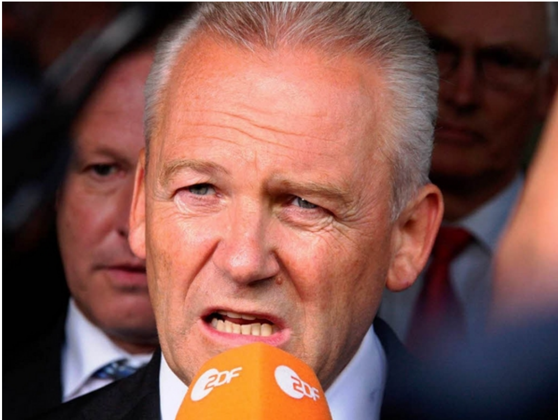
Zeigte Gesprächsbereitschaft: Bahnchef Rüdiger Grube